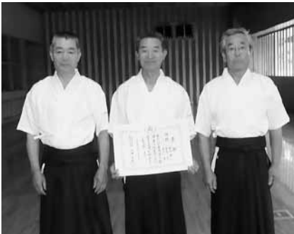
優勝 みどりBチーム