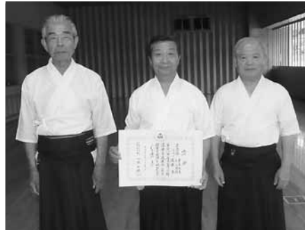
準優勝 高崎Aチーム